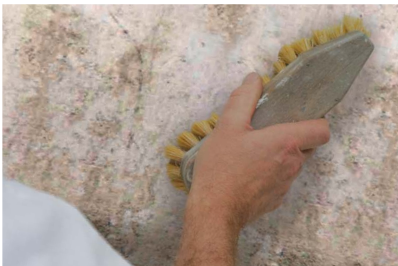
Mehaničko mokro čišćenje

Proizvodi Caparol AquaSperrgrund fein ili Filtergrund grob upotrebljavaju se uvijek kad se nakon toga nanosi premaz na bazi vode